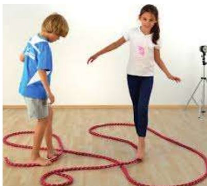
Der heiße Draht