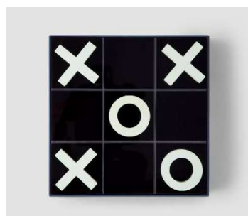
Tic Tac Toe